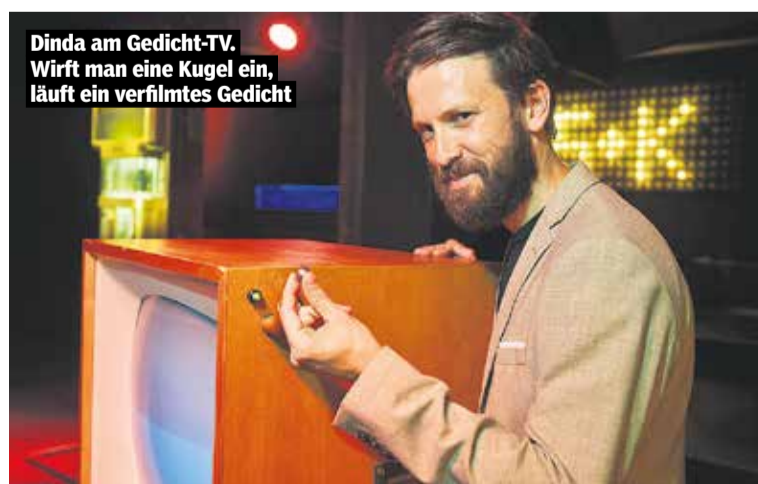
Dinda am Gedicht-TV. Wirft man eine Kugel ein, läuft ein verfilmtes Gedicht

Schon als kleines Kind fing er an, Dinge selbst zu bauen. „Meine Mutter ist Pfarrerin. Ich war von Anfang an der Hausmeister, musste mich um die Sachen im Pfarrhaus kümmern. Und wenn du schon als zehnjähriger mit Stichsäge und Schlagbohrer arbeitest, dann verlierst du schnell die Hemmungen vor echtem Handwerk. Davon profitiere ich mittlerweile. Mein Beruf erlaubt mir, unterschiedlichste Dinge anzupacken. Ich habe mir nie Grenzen gesetzt, meinen Horizont zu erweitern.“