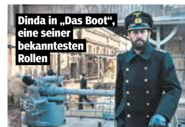
Dinda in „Das Boot“, eine seiner bekanntesten Rollen