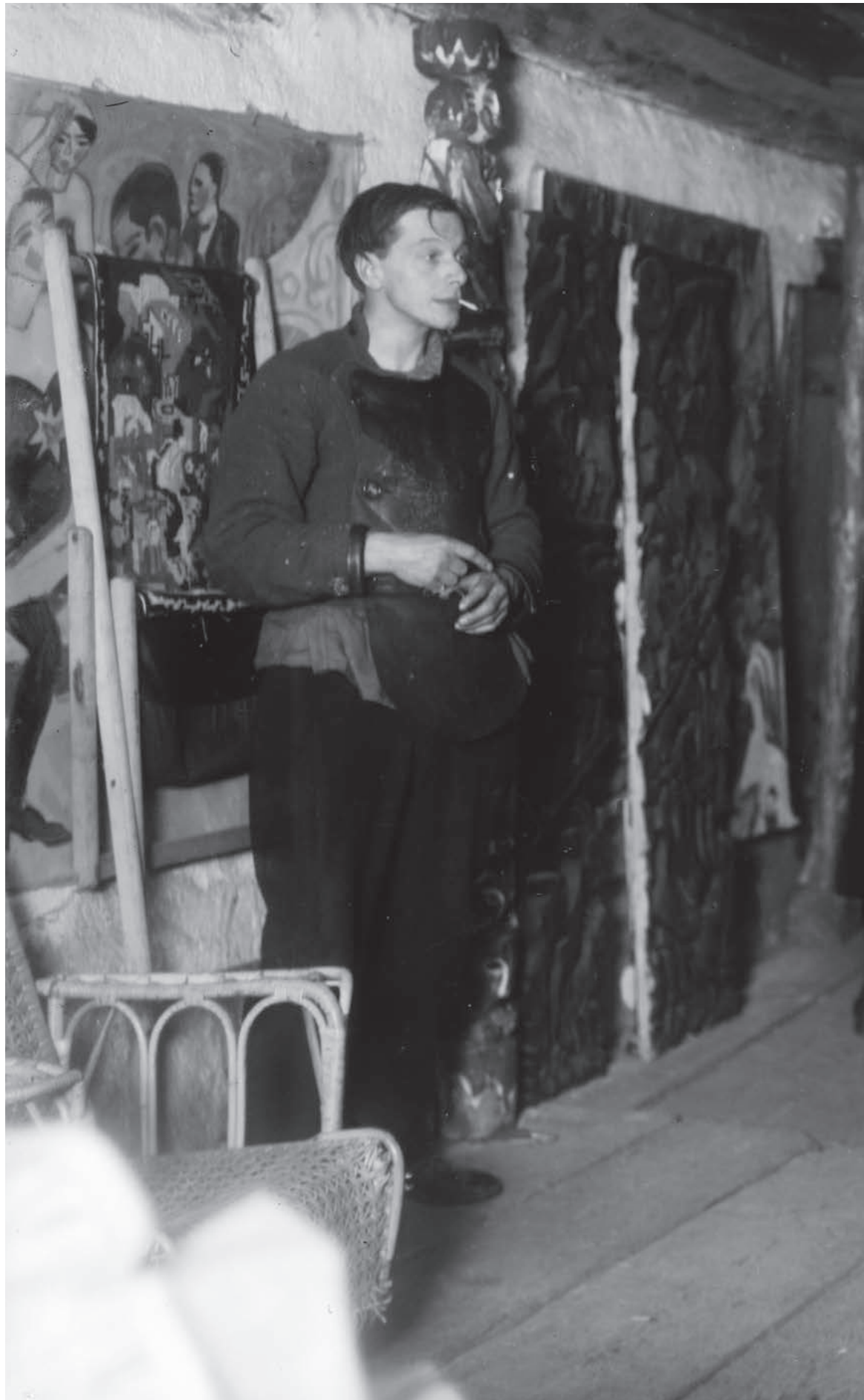
Ernst Ludwig Kirchner, Bauerntanz im Ober- geschoss des Hauses "In den Lärchen" mit Selbstporträt links, 1919/20 | Peasant dance on the upper floor of the house "In den Lärchen" with self- portrait on the left, 1919/20